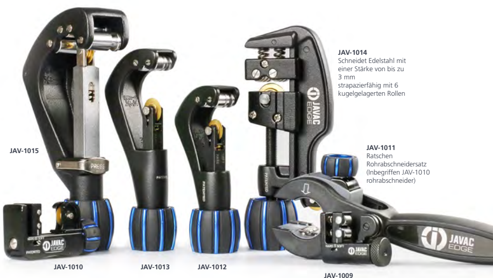
JAV-1014 Schneidet Edelstahl mit einer Stärke von bis zu 3 mm strapazierfähig mit 6 kugelgelagerten Rollen