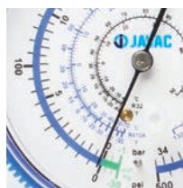
Aguja anti vibración