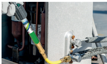
Injektion des Färbemittels durch Drehen des Griffs.