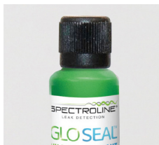
Conexión de 1/4"

Con la confianza de más OEM de HVAC/R que cualquier otra marca