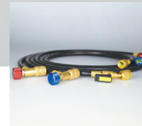
*Mangueras Safe Seal