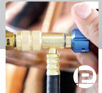
Casquillo giratorio de seguridad, diseño One Touch